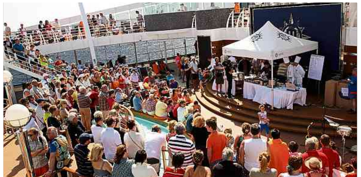
Die PäischtCroisière 2017 wird an Bord der luxuriösen MSC Meraviglia, dem nagelneuen Schiff der Reederei MSC, stattfinden.